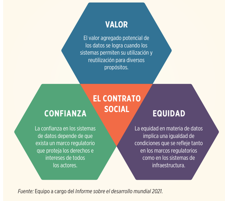
Gráfico 2 El contrato social para los datos

utilizar y aprovechar los datos, tanto entre países ricos y pobres como entre los habitantes ricos y pobres de dichos países. Habitualmente, las personas pobres no se ven plenamente reflejadas en las bases de datos del sector público ni en los datos captados por las empresas privadas. Al mismo tiempo, muchos países pobres carecen de capacidad estadística y conocimiento técnico sobre el manejo de los datos. También les falta la infraestructura necesaria para transmitir rápidamente su propio tráfico de datos a través de internet y acceder de manera asequible a servicios modernos de almacenamiento de datos y computación en la nube. Su reducida escala económica limita además la disponibilidad de datos para desarrollar la inteligencia artificial (aprendizaje automático) y dificulta el surgimiento de empresas locales de plataforma que puedan ser competitivas a nivel mundial. A fin de lograr mayor equidad en el sistema mundial de datos, se requieren esfuerzos para abordar ambos desafíos.